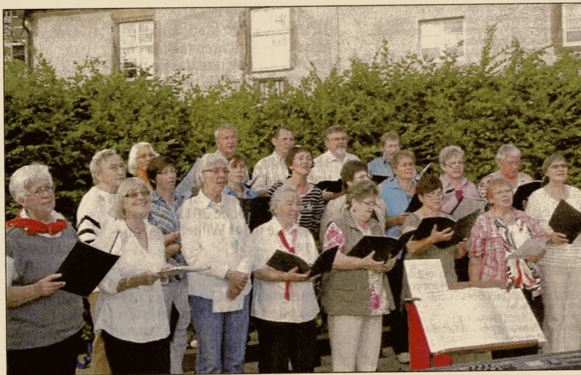
Gute Unterhaltung: Der Kirchen- und Gospelchor Morschen sang zum Jubiläum auch Lieder aus dem „Liederzyklus Sommerhaydau“.